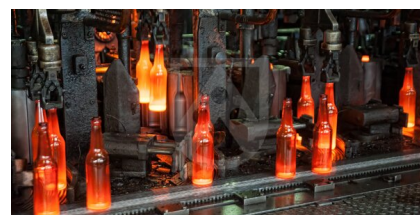
ガラス瓶のグリッパー

Röchling Industrial. Empowering Industry.