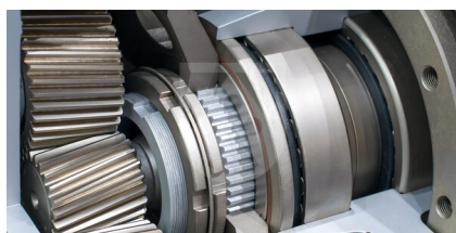
電気自動車向けスラストワッシャー